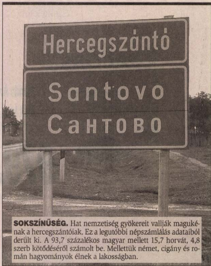
SOKSZÍNŰSÉG. Hat nemzetiség gyökereit vallják maguknak a hercegszántóiak. Ez a legutóbbi népszámlálás adataiból derült ki. A 93,7 százalékos magyar mellett 15,7 horvát, 4,8 szerb kötődéséről számolt be. Mellettiük német, cigány és román hagyományok élnek a lakosságban.