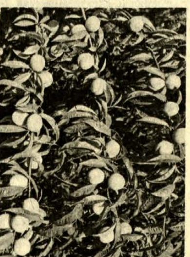
● A korai érésű fajták is darabosabbak és színesebbek lesznek. Jobbra: a gyógymetszés eredménye: egy fáról egy mázsás barackot szednek (részlet egy ilyen „átállított” fáról).