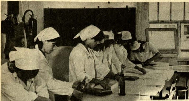
● Ma még csak lecke a pénztárgép kezelése, de holnap már munkaként gyakorolják a Marikák. Balra: készül a borospalackok izlése, tetszetős köntöse.