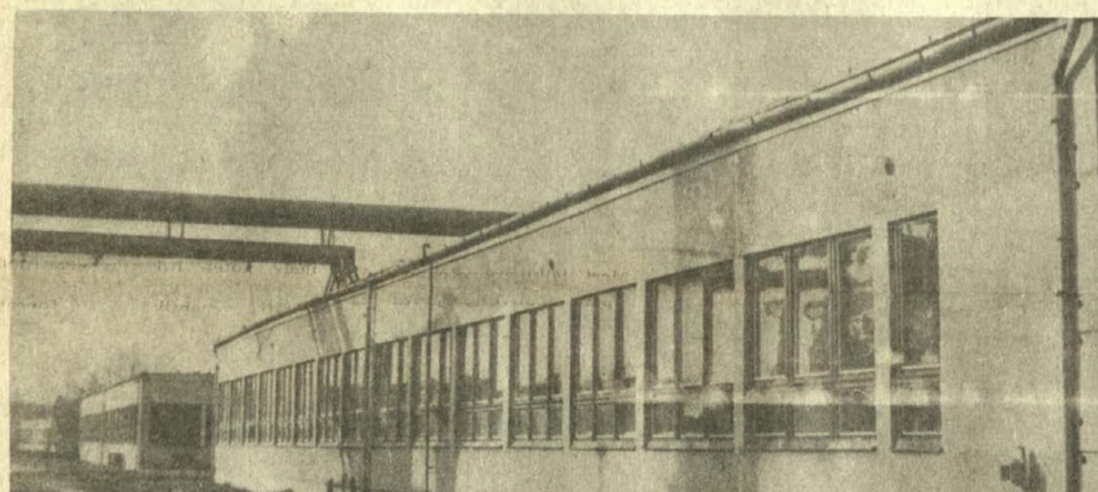
● Az alsó képen: A svéd heverők bajai műhely-csarnoka.