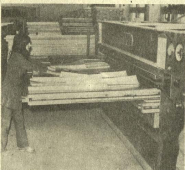
● A furnirotást hidraulikus prés könnyíti meg, amely 200 kilós nyomást fejt ki.