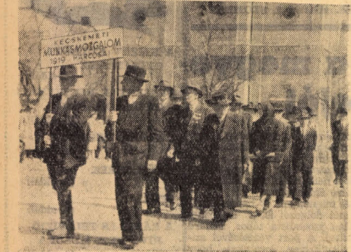
Kommunista veteránok a kecskeméti felvonulás élén.

Jánoshalmán április 30-án fákiyas felvonulással ünnepelték a munkásosztály nemzetközi ünnepének előestéjét. A felvonuláson mintegy 1500 ember vett részt. Másnap négyezer ember vonult fel. Az ünnepség egyik fénypontja 300 úttörő fogadalom tétele volt.