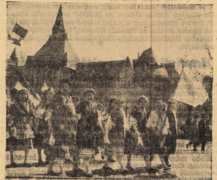
A színpompás felvonulás résztvevőinek egy csoportja.

A három és fél óras ünnepi felvonuláson csaknem félmillió fővárosi dolgozó tett hitet a proletár nemzetköziség eszméi, a béke és a népek barátsága mellett.