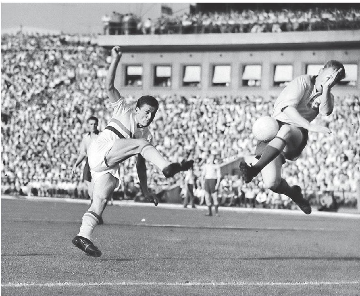
Albert ló! Első válogatott mérkőzésén, 1958-ban, a svédek ellen mindössze tizenhét éves volt

És termelt szépen (nem csak lábbal, mert a fejjátékával is kitűnt). Az FTC-ben 351 bajnoki meccsen 256, a válogatottban 75 mérkőzésen 31 alkalommal „köszönt be”. Ha az utóbbi számot a fiatalok kissé keveslik, nyomban hozzatesszük: huszonöt éves korától hátravont (irányító) középcsatárt játszott a nemzeti együttesben. Baróti Lajos szövetségi kapitány nem merte megmondani neki, mi a terve, ezért segítõ-