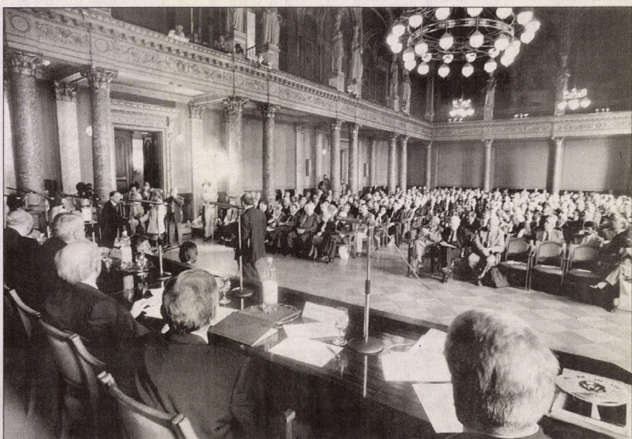
Ülésezik a 168. közgyűlés

Az Akadémia köztestületének kiemelt szerepe van abban, hogy a tudásalapú társadalom kiegyenlítő szerepet töltsön be az ország elszegényedő és gazdagodó rétegei között – jelentette ki elnöki megnyitóijában Glatz Ferenc, a Magyar Tudományos Akadémia elnöke, aki szerint azonban látni kell azt is, hogy a magyar társadalom szociálisan és kulturálisan is szét szakad. Pálkás József akadémikus, az Oktatási Minisztérium politikai államtitkára a kormány képviseletében kijelentette, a tudomány fejlesztését a jelenlegi kabinet a legfontosabb feladatai közé sorolta. A Széchenyi-terv pályázatainak keretében például felgyorsult a felsőoktatási és a kutatóintézmények fejlesztése, emellett a kormány megtette az első lépéseket egy vonzó oktatói-kutatói életút felépítésére. Pálkás bejelentette, a tavaly meghirdetett nemzeti kutatásfejlesztési program 124 pályázatot támogat, 2001–2002-ben 14 milliárd forint jut erre a célra. Kroó Norbert, az MTA főtítkára arról beszélt, hogy a kutatóintézetekben lezajlott konszolidációs program eredményeként ma nincs kritikus állapotban lévő akadémiai intézet. A minőség munka érdekében azonban mielőbb el kell kezdeni a műszerpark megújítását. Az MTA elnökségének döntése alapján éltművéért Akadémiai Aranyéremet