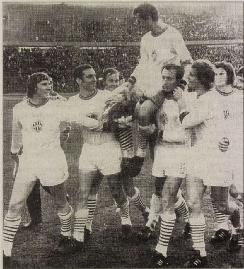
1974-ben, az utolsó bajnoki mérkőzés után a Császár játékosársai vállán búcsúzott