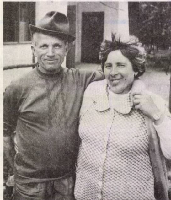
Vera néninek sokat kell aggódnia az uráért

Nem ismertem őket. Két gondolatom volt, vagy orvhalászok, vagy disszidálók. Olyan rész ez, ahol a madár se jár, sűrű dzsungel a part. Láttam, merre ha-