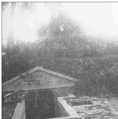
A csurgó-kápolna az 1950-es években

itt töltötték az éjszakát. A következő napokban délutánoként a helyieken kívül jöttek a környező falvak lakói is: mindenki abban reménykedett, hogy a nem mindennapi esemény a saját bajára és gondjára is kedvező hatással lesz.