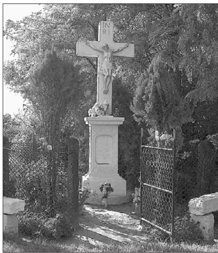
A Vodica-Máriakerthez vezető útleágazás elején álló kőkereszt

A Kossuth Lajos utca északkeleti végén Hercegszántót elhagyva – a régi vármegeyi úton, a falutól mintegy 700-800 méterre – gondosan ápoltságú környezetű útszéli kőkereszt magasodik. Itt rátérve az Igalfőcsatorna (egyres térképeken Mocsáros Ingovány, a helyiek ajkán Gálvocsa vagy Gálbocsa) partjához vezető, egyik oldalán facsémétékkal mostanában beültetett dűlő-útra, jutunk a 2004. szeptember 8-án újjáéledt Vodica-Máriakert kegyhelyhez.