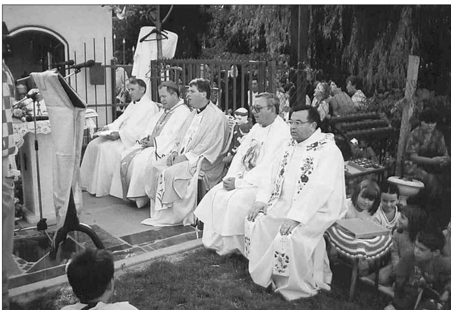
Az újrászentelési érseki mise 2004-ben

A kegyhely jövője szempontjából fontos és örömdetes az a tény, hogy a zarándokok között mindegyik korosztály tagjai megtalálhatók. A későbbiekben talán érdemes lenne megfontolni a templomtól vagy a falu szélétől induló processziós jellegű za-