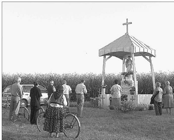
A zarándokok elköszönnek a kegyhelytől

rándoklatot. Jó lenne javítani az ide vezető földút minőségén, mert száraz idő esetén az autók mozgása miatti por, nedves időben a sár nehezíti Vodica-Máriakert megközelítését.