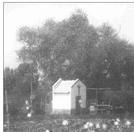
Virágokert a kegyhely körül az 1950-es évek elején