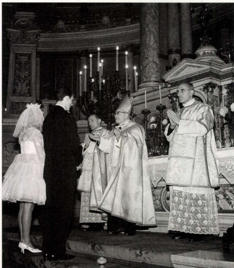
Esküvő a bazilikában

lavírozta magát, hogy elképesztő manőverek után látszólag könnyedén szabaduljon. Filmen fennmaradt két Albertszóló, elképesztő szalombok a '66-os magyar-brazilon – gyakran gondolom, hogy ezekért és csakis ezekért kapta meg az aranylabdát. Jól játszott máskor is, de ezt a harminc-harmincöt másodpercet sem múlhatja felül. Ha újranézem, ma is hiány-