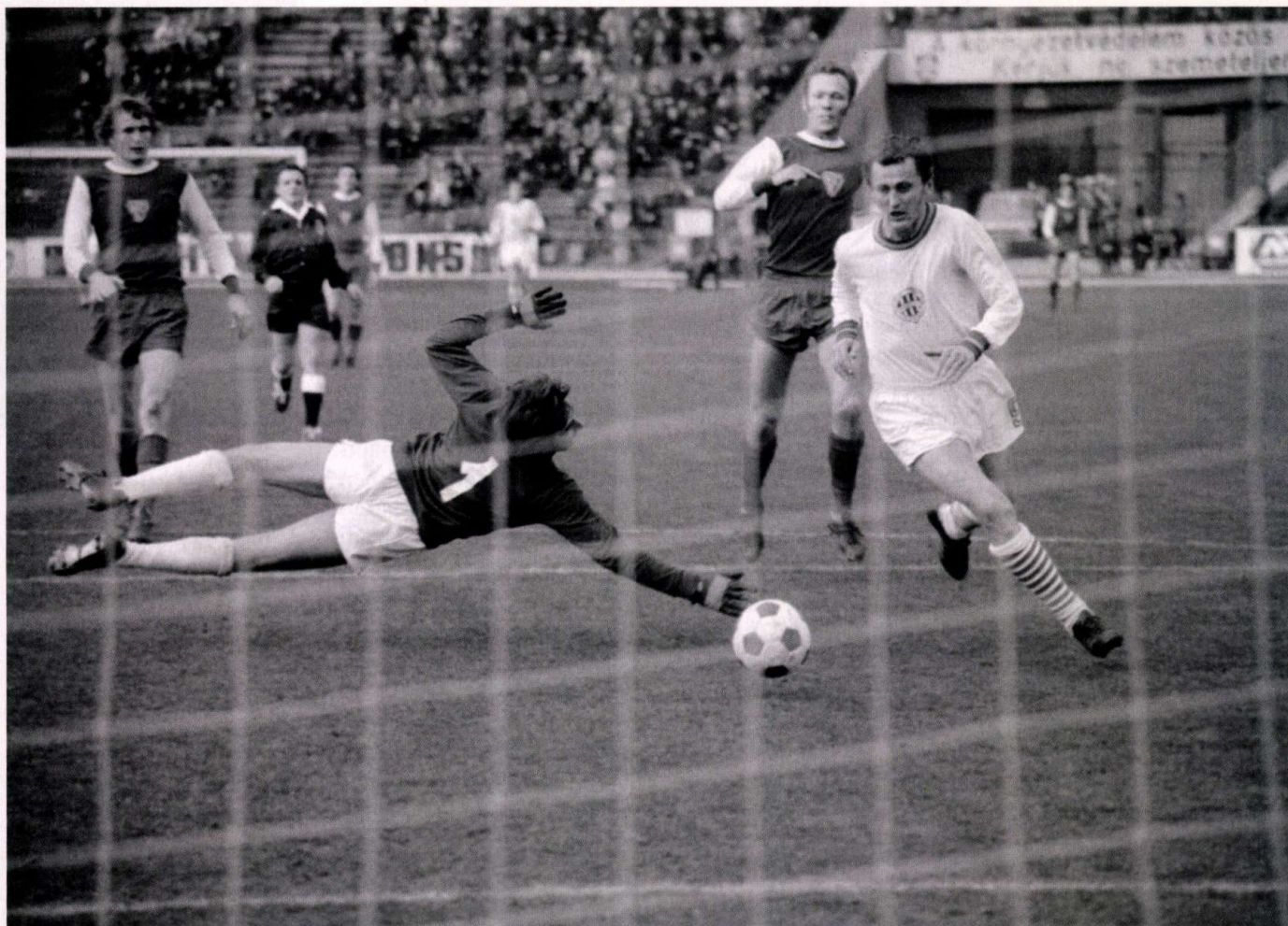
Egy gól a sok közül